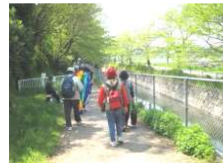
以前ウォーキングした時の写真です

ミニ鉄道にも乗り、全員こども気分ではしゃいでしまいました。今回は3名の参加でしたが、みなさんととても楽しんでいただきました。