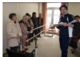
リハビリ室での見学風景

院外ではボランティアさん力作の池で緋鯉が優雅に泳ぎ、春の芽生えが楽しみな素敵な中庭散策でした。