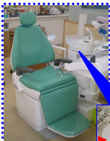
うがいしやすいように動かせます

現在診療されている方、また、診療されていない方は4月18日『 良い歯の日 』を機会に、ぜひ新しい診療ユニットの座り心地を確かめてみてください♪