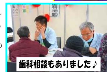
歯科相談もありました!

安心して住み慣れた地域で暮らせるよう、組合員・職員・地域が一体となり、医療生協のさらなる発展を望み、歩んでいきたいと思っております。