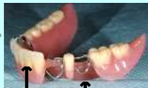
↑ 人工歯 ↑ クラスプ