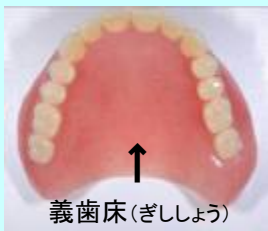
↑ 義歯床(ぎししょう)

また入れ歯には保険適用の物と適用外の物があり、種類もいくつかあります。疑問点などありましたら、是非お気軽にご相談ください!!